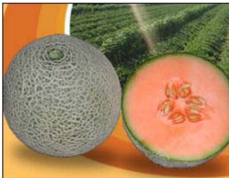
De injusta calificó la medida de EU aplicada al melón hondureño

Asimismo, calificó la alarma como innecesaria al explicar que en los lugares donde supuestamente se registraron los casos de salmonella, no sólo productos hondureños especialmente legumbres y frutas se éste país se venden, por lo que calificó que es "injusta" la alarma que vendría afectar la economía de miles de hondureños de la zona sur y de esta empresa..